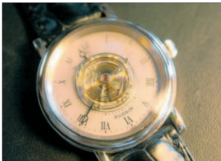
So sieht die edle Armbanduhr aus: eine Haldimann H1 mit fliegendem Tourbillon für rund 100 000 Franken.