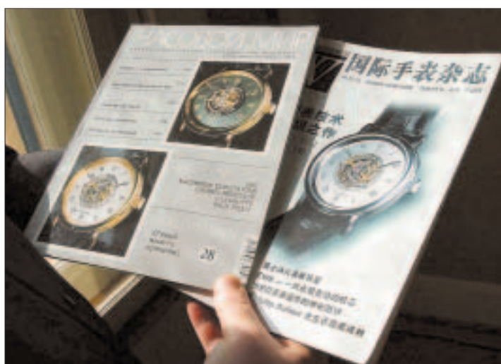
Schlagzeilen im Ausland: Russische und chinesische Uhrenmagazine zeigten die Haldimann H1 auf dem Titelbild.