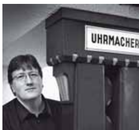
Beat Haldimann Haldimann Horology Switzerland

204 Seiten, zahlreiche Illustrationen, deutsch und englisch, Leineneinband mit Schubler CHF 69.– / € 60,00 ISBN 978-3-7272-1147-8 Bereits erschienen