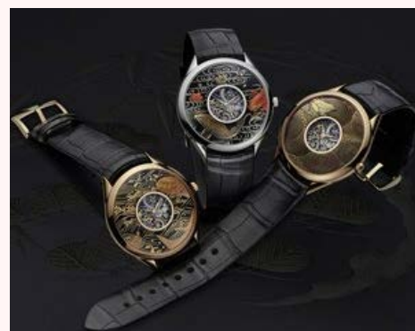
Deuxième coffret des Métiers d'Art « La Symbolique des Laques » de Vacheron Constantin